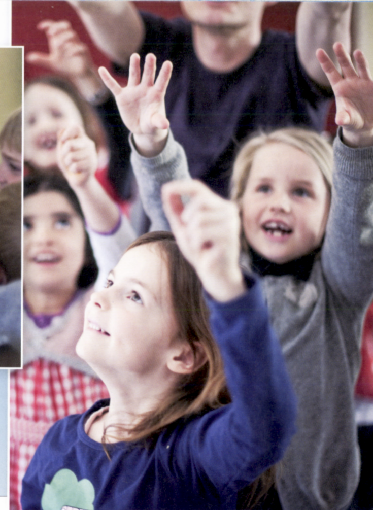
De anvendte billeder er taget ved et lignende forløb (kun børn og kun genskabelsen) på N. Zahles Skole.

– konservatoriet for musik og formidling og begge med klassisk sang som specialfag) blev der formuleret en introduktion, hvis omdrejningspunkt var en genskabelse af (dele af) operaen sammen med publikum.